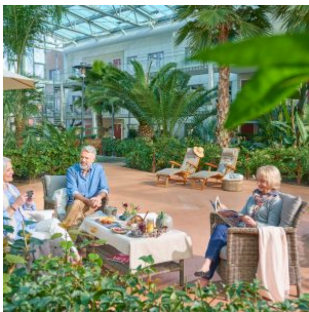
Bild ur Bovierans koncept Nova som kommer att uppföras i Faluns nya bostadsområde Surbrunnshagen.

Bovieran utvecklar seniora boenden med unika mötesplatser för gemenskap och umgänge. I Surbrunnshagen kommer de att bygga 36 lägenheter med en total boarea på 2 112 m 2 för +55 och planeras stå klara 2021. De tre huskropparna, som byggs enligt deras koncept Nova, kommer att byggas samman med en vinterträdgård.